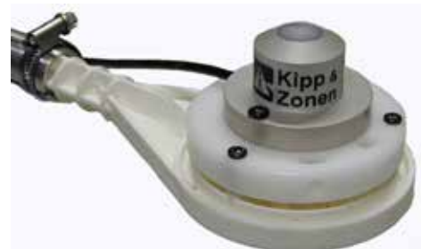
Pyranometer SP-Lite mit Montagehalterung